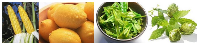
とうもろこし かんきつ 茶 ホップ