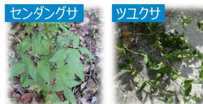
センダングサ ツクサ