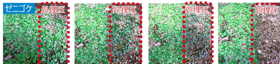
処理前 → 5分後 → 30分後 → 3時間後