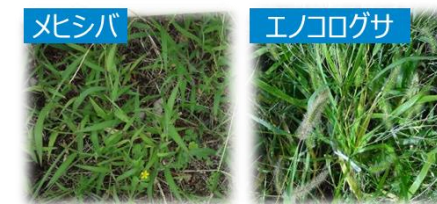
メシバ エノコログサ