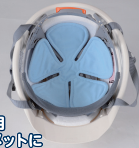
工事用ヘルメットに