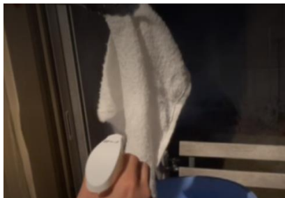
当社フリーズテック冷感スプレー