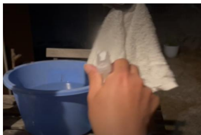
他社アルコール入り冷感スプレー

フリーズテックはまったく燃えなかったのに対し、他社アルコール入りスプレーは一瞬にして炎が広がりました。