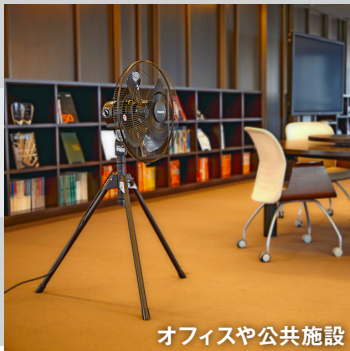
オフィスや公共施設